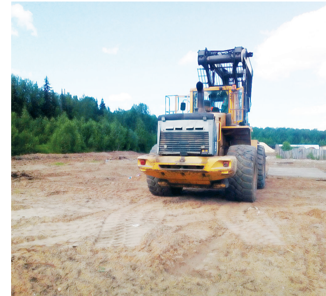
Ведутся работы по строительству терминала