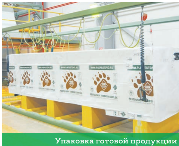
Упаковка готовой продукции